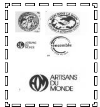
Labels du commerce équitable

nement (social, économique, écologique, culturel). Cette réalité se vérifie dans l'ensemble du commerce, tant au niveau local qu'international. » (La Plate-Forme pour le Commerce Equitable)